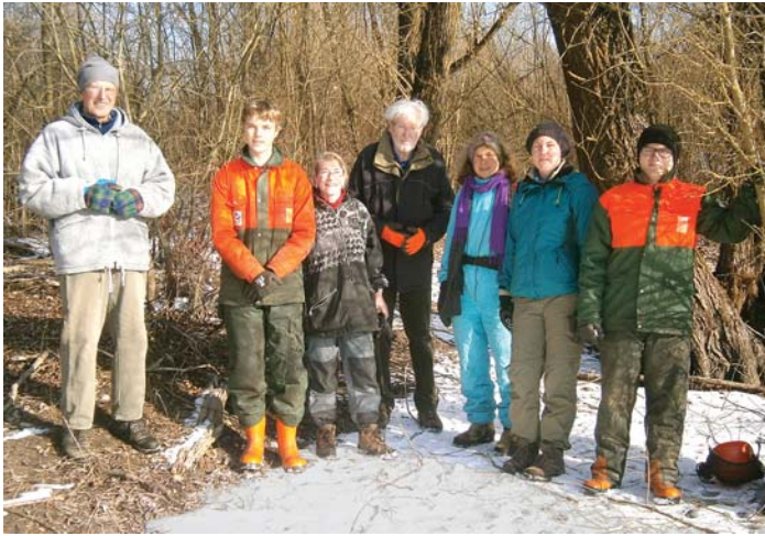
Im Rahmen eines Interreg-Projektes legt die BUND-Gruppe Engen/Mühlhausen-Ehingen ein Kleingewässer für Amphibien und Libellen an.