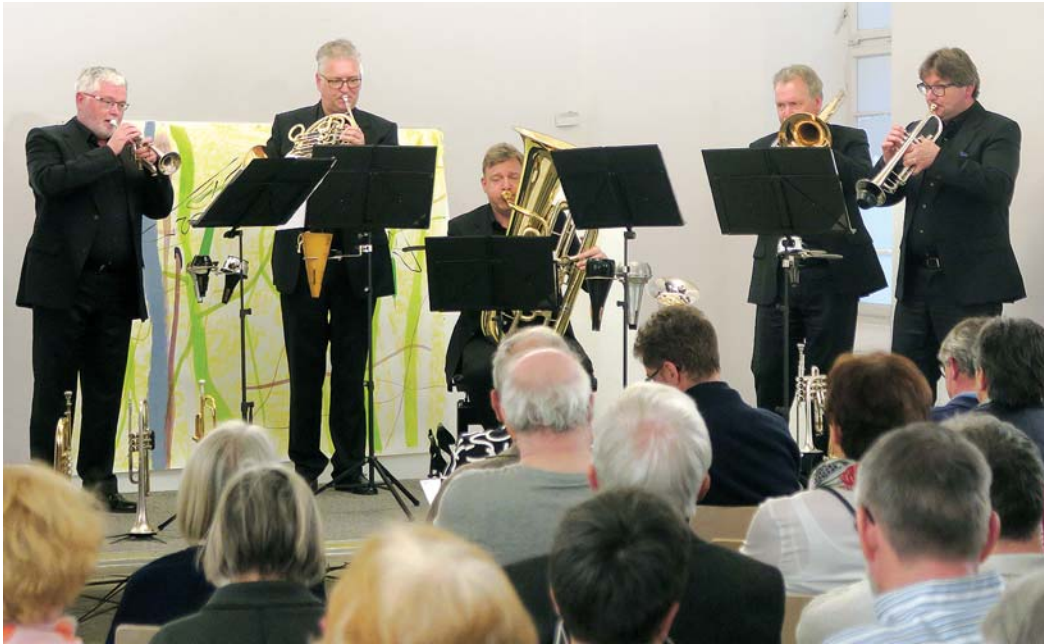
In Topform präsentierten sich die fünf Musiker des Ensembles »Mannheim Brass«, die auf Einladung der Stubengesellschaft Engen am vorvergangenen Sonntag im Städtischen Museum Engen zu Gast waren.