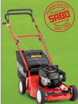
SABO 43-COMPACT SM

UVP* 569 € Unverbindl. Preisempfehlung inkl. gesetzl. MwSt. des vergleichbar ausgestatteten Serienmodells: 699 €